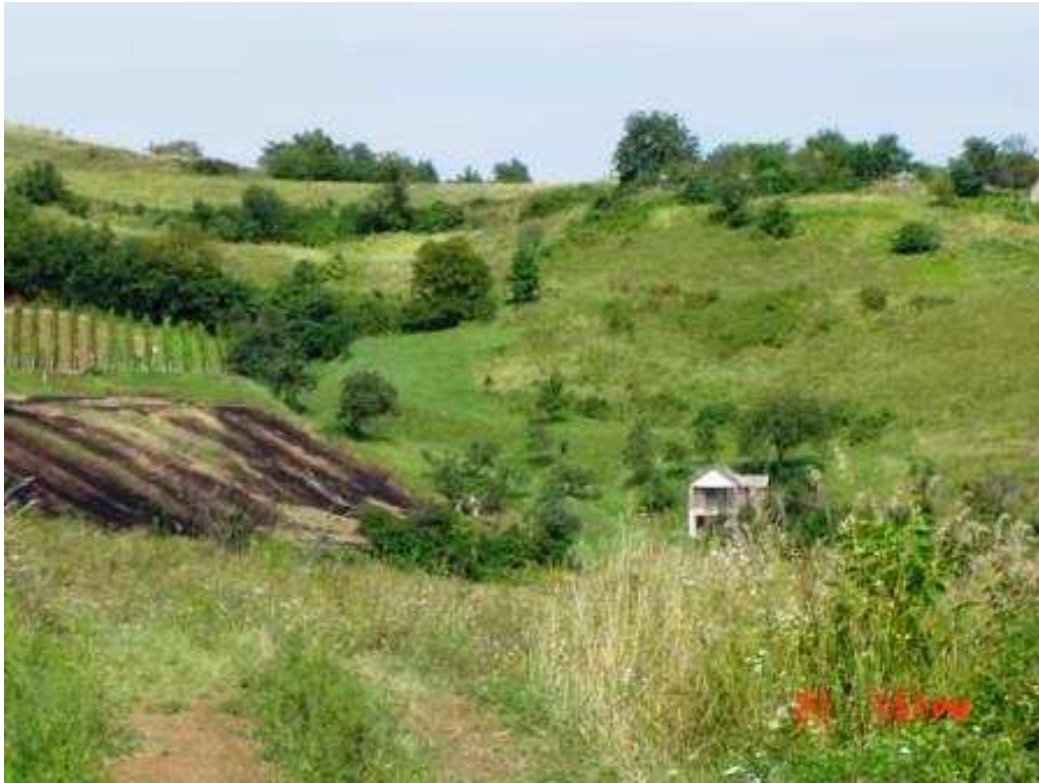
Wijnhuisjes in Magyaregregy

Magyaregregy heeft voldoende pensions om te overnachten. Het grootste pension heet Vadásztenye Panzió. Het is een erg rustiek pand met een geschiedenis als watermolen. Je kan er tevens heerlijk dineren.